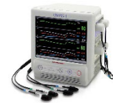
機能検査オキシメーター (浜松ホトニクス株式会社製)

※1 Nirengi S, et al. Obesity (Silver Spring). 2015;23(5):973-80. doi: 10.1002/oby.21012.