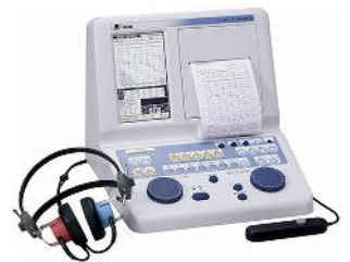
純音オーディオメータ (リオン株式会社製)

音を出して耳鳴りの音が消えるかどうか、また、消えた場合には、どの大きさを消えるかを調べる検査です。 耳鳴りが消えていた時間、あるいは音が変化しているかを測定します。