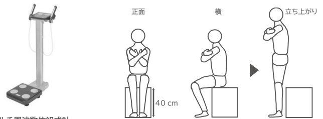
マルチ周波数体組成計 （株式会社タニタ製）

骨格筋量は、体組成計を用いて生体電気インピーダンス法にて測定します。生体電気インピーダンス法とは、身体に微弱な電流を流し、その際の電気の流れやすさ（電気抵抗値）を計測することで体組成を推定する方法です。脂肪はほとんど電気を通さないが、筋肉などの電解質を多く含む組織は電気を通しやすいという特性を利用しています。筋肉は、断面積が大きいほど電気抵抗値が低くなることから、測定した電気抵抗値と身長から筋肉組織の長さを割り出し、太さと長さを組み合わせることで筋肉量が算出されます。