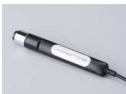
Corneometer (コルネオメーター)

Courage+Khazaka (ドイツ) 社製の Corneometer を用いて評価します (下図参照)。