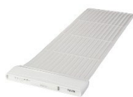
睡眠計 スリープスキャン クラスI(一般医療機器) (株式会社タニタ製)