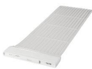
睡眠計 スリープスキャンクラスI（一般医療機器） （株式会社タニタ製）